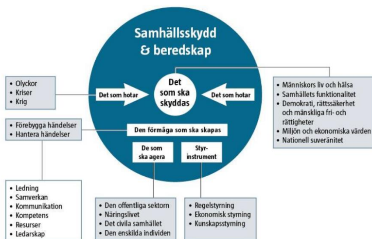
Figur 1.

Värnamo kommun verkar för en trygg och säker kommun för alla som bor, vistas och verkar i kommunen. För att nå framgång arbetar kommunen med ett helhetsgrepp om frågor som rör skydd mot olyckor och krishantering vilket sträcker sig från den vardagliga händelsen till höjd beredskap. Kommunen arbetar för att värna våra skyddsvärden. Det som ska skyddas är människors liv och hälsa, samhällets funktionalitet, demokrati och mänskliga fri- och rättigheter, miljö- och ekonomiska värden samt den nationella suveräniteten. Det som kan hota våra skyddsvärden kan vara allt från vardagliga händelser till händelser under höjd beredskap. För att värna våra skyddsvärden är det viktigt med ett förebyggande och proaktivt arbete där det skapas goda förutsättningar för att minska sannolikheten och konsekvensen för händelser samt att det skapas goda förutsättningar att minimera konsekvenserna vid händelser.